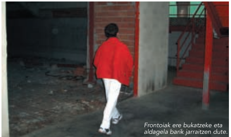
Frontoiak ere bukatzeke eta aldagela barik jarraitzen dute.