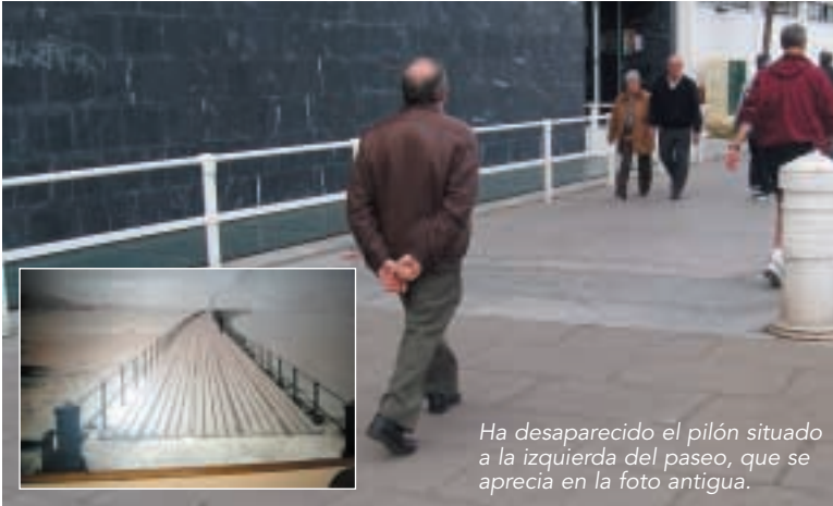
Ha desaparecido el pylon situado a la izquierda del paseo, que se aprecia en la foto antigua.

www.batzokiportugalete.net Portugaleteko EAJ-PNV web orrialdearen helbidea da. Sartu zaitetz eta gure udal-taldearen jarduerari buruz informazioa eskuratu ahal izango duzu, gure herriari buruzkoaz gain. Gainera, gure eztabaida-gunean zure iradokizunak utzi edota Radio Euskadiren Cocardito Madrileño-gaz ondo pasa ahal izango duzu.